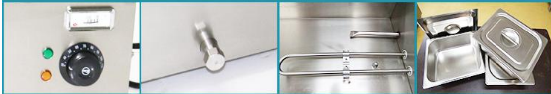
BM12十二格保温汤池机