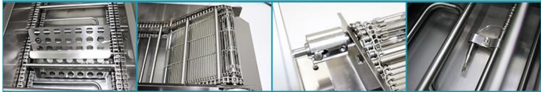
DZZ96大型全自动油炸机