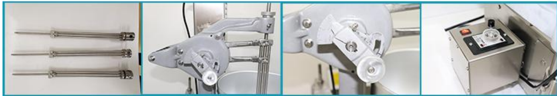
DD02 电动波提机 (料桶头)